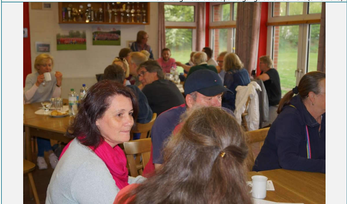
Abbildung 2 Abschluss im Sportlerheim (cima 2019)