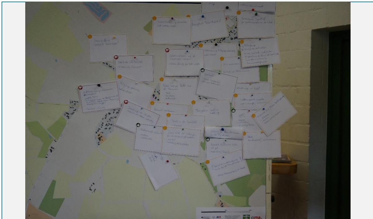
Abbildung 3 Ergebniswand (cima 2019)

Datum: 27.04.2019– Zeit: 14:00 – 17:00 Uhr – Ort: Gemeinde Sievershütten