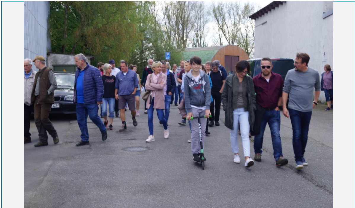
Abbildung 1 Start des Spaziergangs durch den Ort (cima 2019)

Datum: 27.04.2019– Zeit: 14:00 – 17:00 Uhr – Ort: Gemeinde Sievershütten